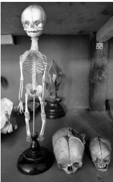
4. Скелет новонародженого та два дитячих черепи. Виробник: Фабрика № 3 «Медичні навчальні препарати», Москва, СРСР, 1957. Кабінет пластичної анатомії НАОМА. Фото: А. Мельничук, 2021

У 1983 році було придбано анатомічний апарат тазостегнового і ліктьового суглобів із м'язами. Також в колекції