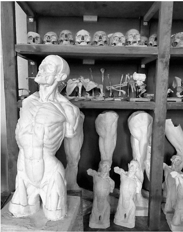
1. Методичне забезпечення кабінету пластичної анатомії НАОМА.