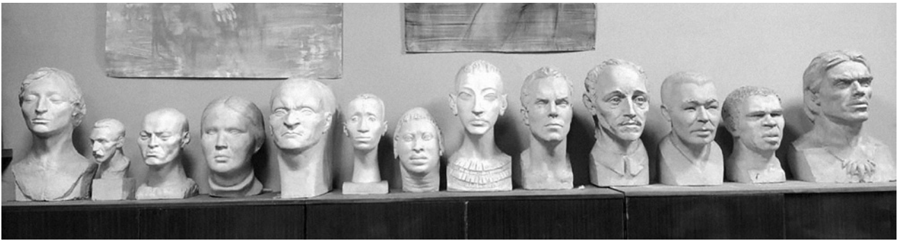
2. Гіпсові зліпки антропологічних рас з кабінету пластичної анатомії НАОМА.

Також є ще одна серія гіпсових зліпків (рис. 3), виконаних студентами скульптурного факультету під керівництвом Л. Трубікової у 1994 році. Це анатомічні черепи пітекантропа та неандертальця, «антропологічні типи» (реконструкція м'язів обличчя за черепною основою людини з Ла-Шапель-о-Сен) і «копія голови неандертальця» виконана французьким антропологом Марселеном Булем. Ці експонати (зліпки 2 і 3 зліва на рис. 3) були створені за книгою Дж. Констебла «Неандертальці» (1978), в якій сказано, що «дві реконструкції, зроблені спеціально для нашої книги та відтворені тут анфас та у профіль, показують, як виникають різні тлумачення. Обидві голови ліпилися по одному неандертальському черепу, який належав так званій «людині з Ла-Шапель-о-Сен», але виглядають вони абсолютно по-різному. Відмінність виникла завдяки тому, що скульптор, ніде не відступаючи від законів анатомії, вибирав різні варіанти можливого розташування м'язів тканин, які визначали зовнішній вигляд голови і обличчя, але давно вже зникли безслідно, оскільки на відміну від кісток вони не скам'яніють» [15, с. 86]. Далі в книзі йдеться, що «скульптор наклав м'язи на череп таким чином, що неандерталець знайшов схожість із сучасною людиною — опуклі надбрів'я та важка нижня щелепа