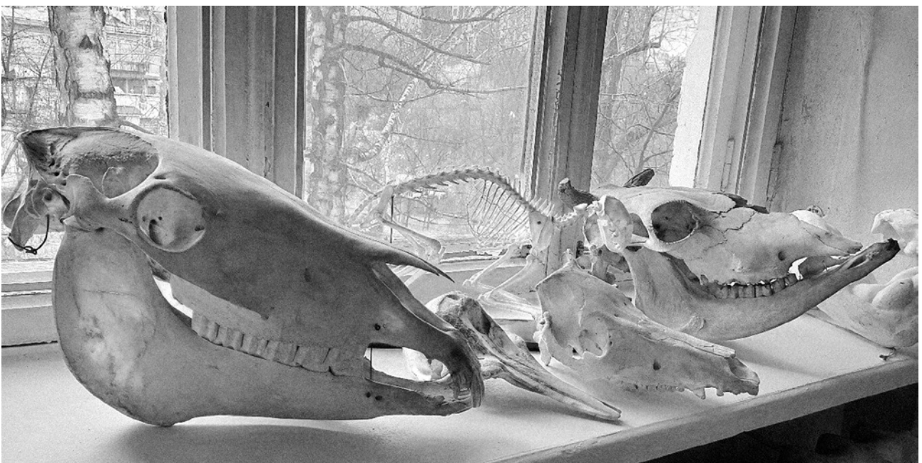
6. Черепи корови, коня, собаки, дельфіна та скелет kota. Кабінет пластичної анатомії НАОМА.

Всі згадані матеріали, як-от анатомічні препарати, муляжі, таблиці, атласи, анатомічні рисунки, слайди, анатомічні посібники тощо, є важливими для організації занять з пластичної анатомії. Зазначені методи спрямовані на формування в студента просторового уявлення про органи та зовнішню будову людського тіла і його рух. Це є підґрунтям до наукової точності пропорцій,