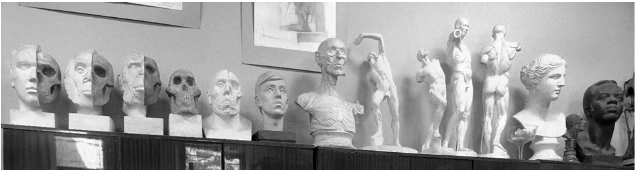
3. Гіпсові заліпки та екорше кабінету пластичної анатомії НАОМА.

кабінету є скелет новонародженого та два дитячих черепи (рис. 4). До 1990 року кількість черепів налічувала 15 одиниць, а до 2021 році їх стало 25.